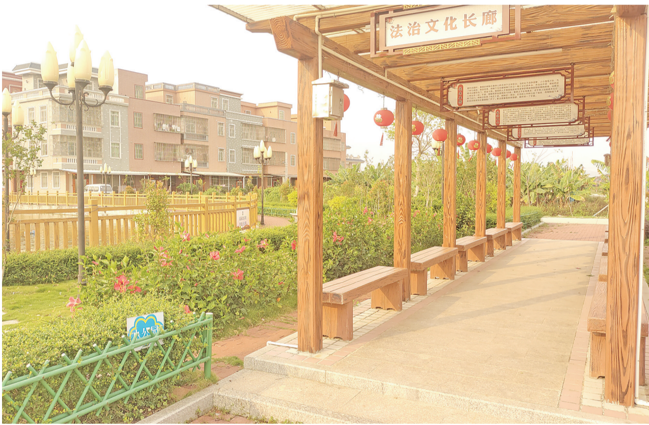
奕庵村建设法治文化长廊,让村民在潜移默化中增强法治意识。

为进一步改善农村人居环境,助力绿美湘桥生态建设,奕庵村因地制宜,在全村范围内开展“美丽庭院”评比活动,发动村民参与环境卫生整治的积极性,带动群众从自身做起,从家