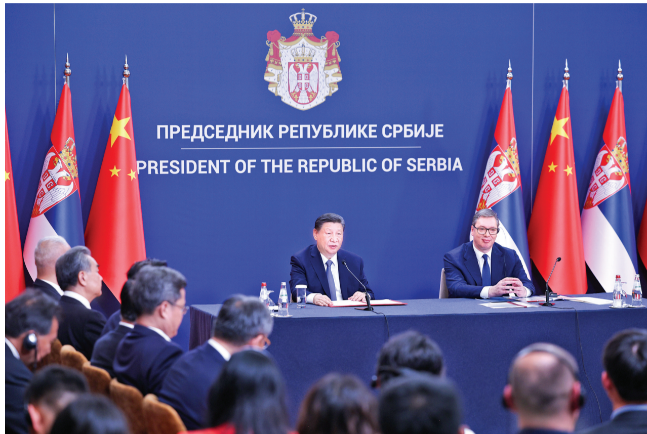
当地时间5月8日中午,国家主席习近平在贝尔格莱德塞尔维亚大厦同塞尔维亚总统武契奇会谈后共同会见记者。