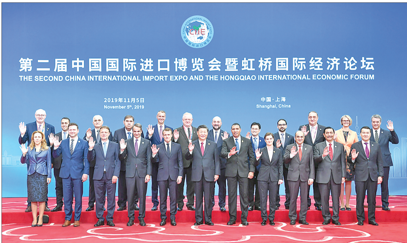
▲国家主席习近平出席开幕式并发表题为《开放合作 命运与共》的主旨演讲。▲开幕式前,习近平同外方领导人集体合影。

在热烈的掌声中,习近平宣布,第二届中国国际进口博览会正式开幕。习近平发表主旨演讲。