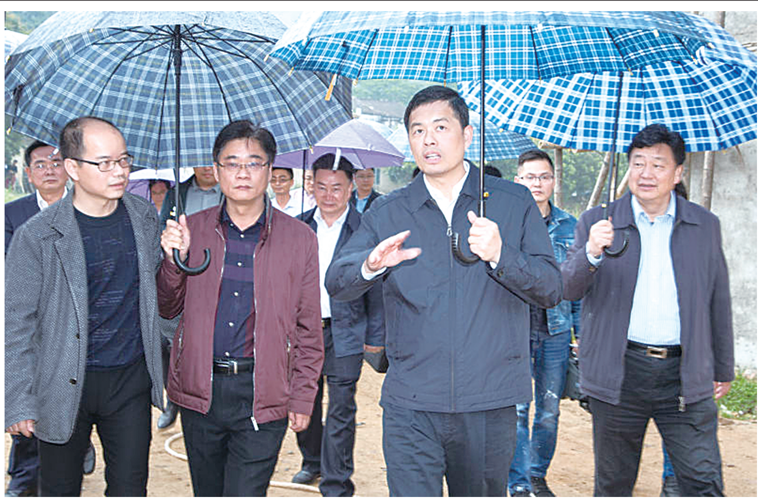
市委书记刘小涛亲临黄正碧桂园幸福新村,现场检查新村建设进展情况。

健全部门联动工作机制,全面落实“三保障”政策。 市扶贫办定期牵头召开精准扶贫工作联席会议,积极采取有效措施,重点落实好教育资助、危房改造和医疗救助等政策保障。今年至11月,我市落实2017-2018学年度贫困学生教育生活费补助7005人。同时,建立贫困家庭本科生教育资助机制,中潮慈善爱心基金2018年共资助贫困本科生368人,发放助学金184万元。危房改造已开工610户,竣工605户。针对脱贫攻坚工作中困难群众关注强烈的因病致贫等问题,深入开展大调研,及时协助制定出台《潮州市关于困难群体医疗保障救助的实施意见》等政策,今年至11月,实施贫困人口医疗救助4299人次,发放救助金868.28万元。对按现行低保政策无法纳入保障的无劳动能力贫困家庭人口,协助制定落实《潮州市精准扶贫建档立卡无劳动能力贫困人口享受基本生活保障金实施方案》,从2017年12月起为他们发放基本生活保障金,实现无劳动能力贫困家庭人口全部纳入政策性兜底保障。