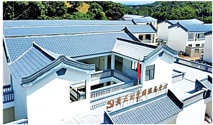
黄正村党群活动中心。

因地制宜,建立健全增收长效机制。 市扶贫办配合市农业局组织开展农业产业现状调查,摸清有关镇街和45个省定贫困村产业发展情况,重新编制《潮州市省定贫困村产业发展指南》,加强农业特色产业引导,着力推进产业扶贫。联合市人社局印发《潮州市2018年贫困劳动力职业技能培训方案》和《关于进一步做好我市职业技能精准扶贫工作的通知》等文件,面向贫困村开展各类实用技术培训,实施“潮州菜师傅工程”,帮助贫困劳动力掌握快速谋生技能,开通“村村通就业信息网”,举办招聘会,多渠道帮扶有就业需求的贫困劳动力就业。