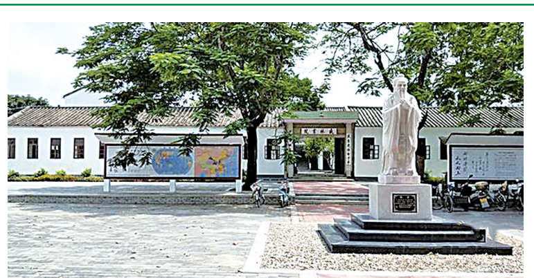
狮峰:依照“一湖一轴多节点”格局,建成盛林书院。