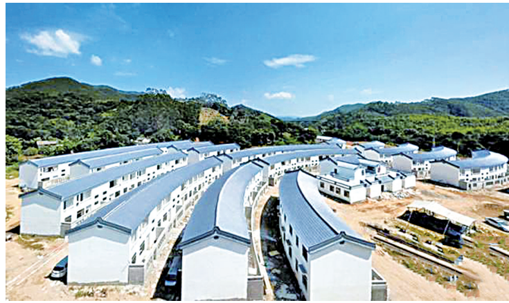
黄正碧桂园幸福新村概貌。