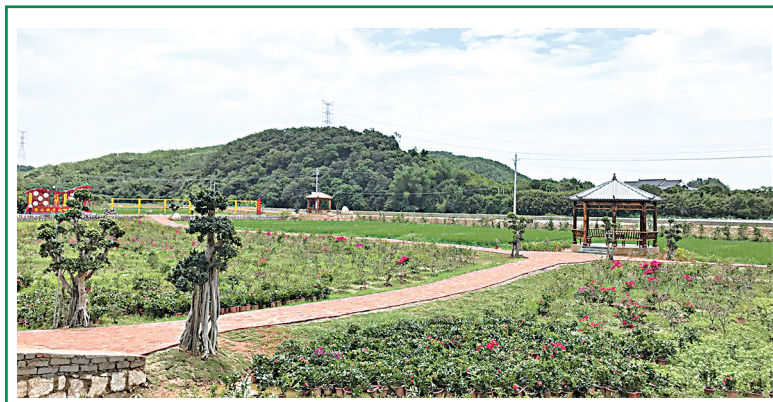
英粉:“一带一路一花园”托起美丽乡村。