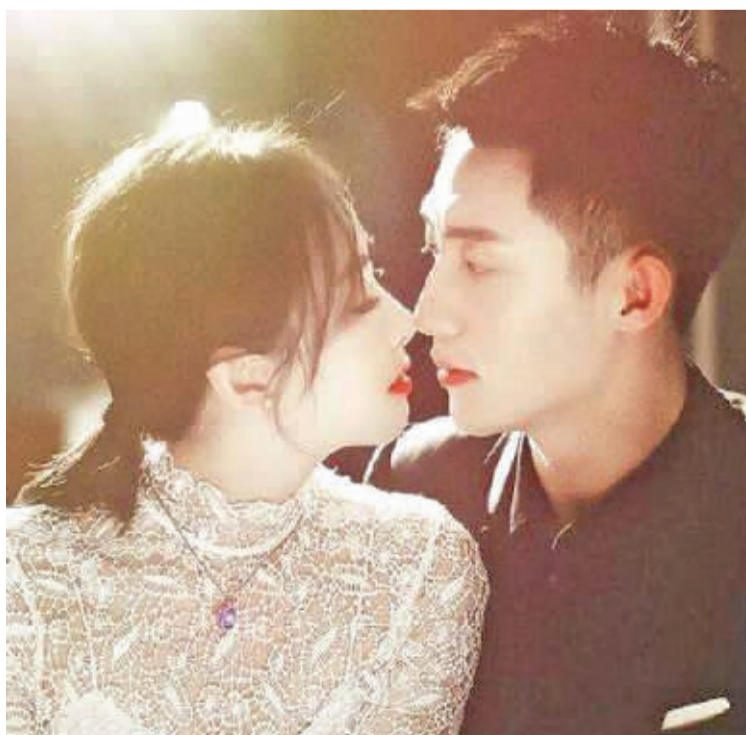
▲《结爱·千岁大人的初恋》

此次《非遗公开课》在展示内容上,涵盖了滚灯、口技、木活字印刷技术、苏绣、潮绣、云锦、侗族大歌、古琴、京剧、少林功夫、舞龙舞狮等10余项国家级非遗代表性项目,其中不仅有融合书法绘画和古风舞蹈的《把酒问青天》首次登上荧屏,湛江人龙舞和遂溪龙湾醒狮传承人以其气势磅礴的“人造龙”上演《龙舞天下》惊艳全场;还有身穿苏绣、潮绣、云锦的模特伴随着霍尊的《卷珠帘》华丽登场,精美服饰秀尽显中国时尚。节目组更以“穿