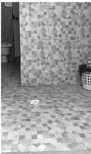
肇门亭巷一公厕里,明明设置有垃圾桶,但存在乱扔垃圾的现象,甚至出现便后不冲水的情况。

冲水。”该负责人说。 “修缮一新的公厕有效解决了游客‘如厕难’问题,也提升了古城公共服务能力。设施齐全、舒适整洁的公厕已逐渐成为我市城市文明形象的新亮点。”市民邱女士告诉记者,有一次,她到牌坊街一公厕上厕所时,看到有群众上完厕所都没冲就径直走出公厕,她提醒了一句,没想到对方竟充耳不闻。看不下去的她只好帮对方冲厕所。“公厕可以说是城市的一面镜子,折射的是市民的卫生习惯和文明素质,这样的习惯和素质,怎么会给来潮州的游客留下好印象呢?”市民陈先生感慨道。 采访中,部分市民认为,有关部门在公厕里张贴宣传标语,借此号召众人共同爱护公厕仍稍显不够,公厕文明主要还得靠市民文明自觉。“使用公厕的市民要有公德心,养成良好的卫生习惯,同时应增强公共意识,自觉爱护和维护公厕卫生设施,才能共同营造一个长效卫生的公厕环境,莫让公厕使人‘望而却步’。”市民余小姐说。